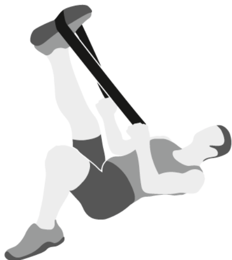
Tração com dorsiflexão e flexão plantar com super band