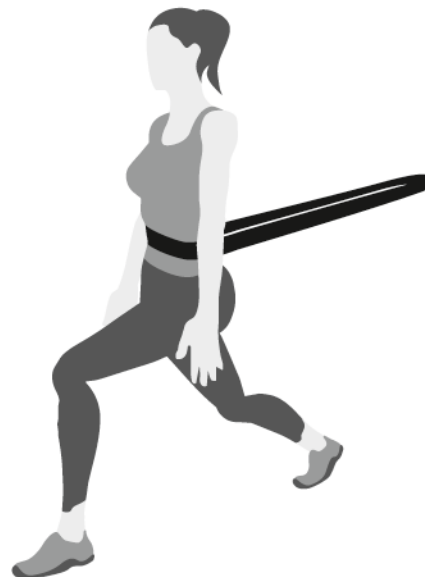
Avanço alternado com super band