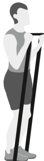
Rosca direta com super band