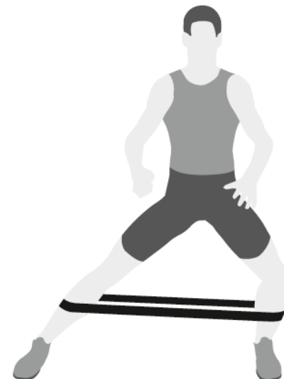
Afastamento lateral com super band